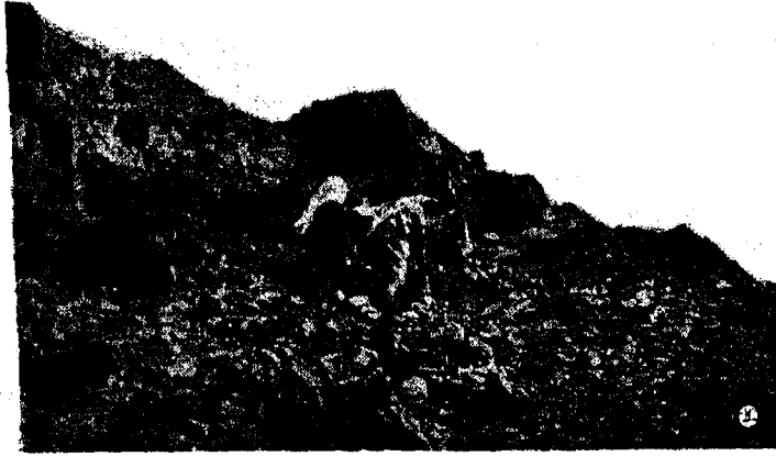
المؤلف يتسلق إحدى هضاب جبل أحد أثناء تجواله حول مواقع المعركة